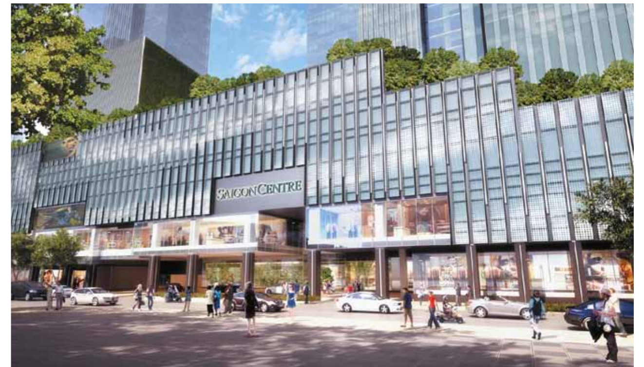
Phối cảnh dự án Saigon Centre (giai đoạn 2)