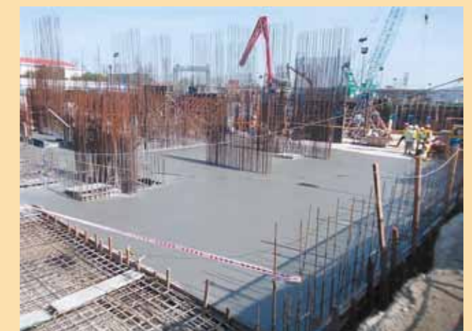
Toàn cảnh tiến độ xây dựng tại Công trình dự án Riviera Point

Nhà mẫu Riviera Point Lối vào cạnh số 582 Huỳnh Tấn Phát, Quận 7, Tp. Hồ Chí Minh Tel: (848) 377 38 777 Fax: (848) 377 34 292 Email: rp@keppeland.com.vn - www.rivierapoint.com.vn