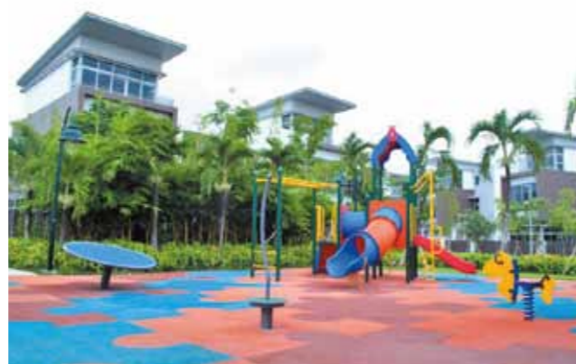
Sân chơi trẻ em