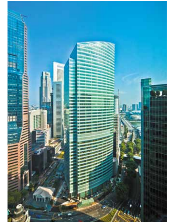
Ocean Financial Centre đạt được đánh giá 5 sao - số điểm cao nhất trong ba hạng mục của Giải thưởng Bất động sản quốc tế 2012

Tòa tháp văn phòng Hạng A cao 43 tầng này đã được trao tặng Giải thưởng Trung tâm thương mại cao tầng tốt nhất, Dự án cao ốc văn phòng tốt nhất và Kiến trúc cao ốc văn phòng tốt nhất tại khu vực Châu Á Thái Bình Dương. Dự án Riviera Point tại Quận 7, Tp. Hồ Chí Minh cũng đã được tuyên dương xuất sắc cho hạng mục "Dự án phức hợp" tại Việt Nam tại giải thưởng này.