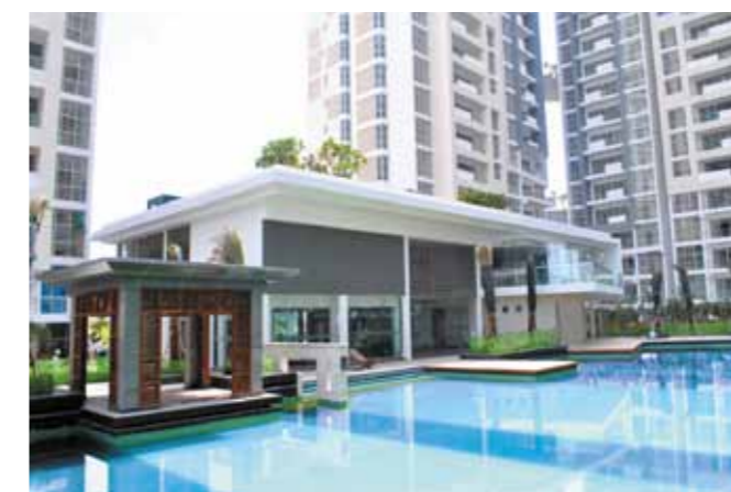
Hồ bơi và nhà câu lạc bộ