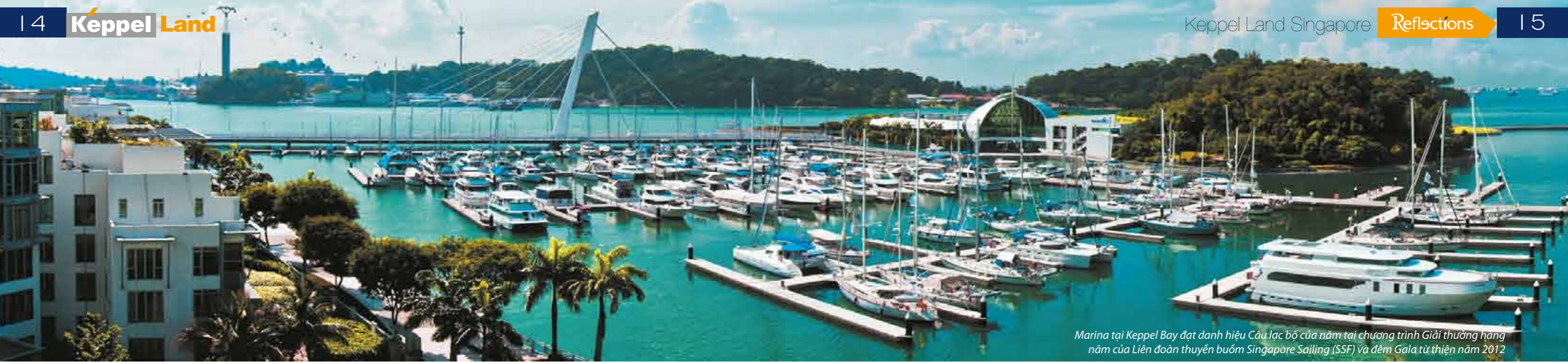
Marina tại Keppel Bay đạt danh hiệu Cầu lạc bộ của năm tại chương trình Giải thưởng hàng năm của Liên đoàn thuyền buồm Singapore Sailing (SSF) và đêm Gala từ thiện năm 2012

triển và xây dựng, về việc đảm bảo quyền và lợi ích của cộng đồng và các tác động có liên quan đến môi trường, cũng như khả năng tài chính và tiếp thị đặc biệt xuất sắc. Đây là giải thưởng đề cao các doanh nghiệp chủ chốt trong lĩnh vực xây dựng và tôn vinh các chủ đầu tư và công ty kiến trúc hàng đầu trong khu vực Đông Nam Á. Giải thưởng được trao cho các công ty có ảnh hưởng lớn đối với môi trường xây dựng tương lai, giúp thị trường hiểu rõ hơn vai trò quan trọng của những công ty này và ảnh hưởng của họ, cả về mặt xã hội và môi trường.