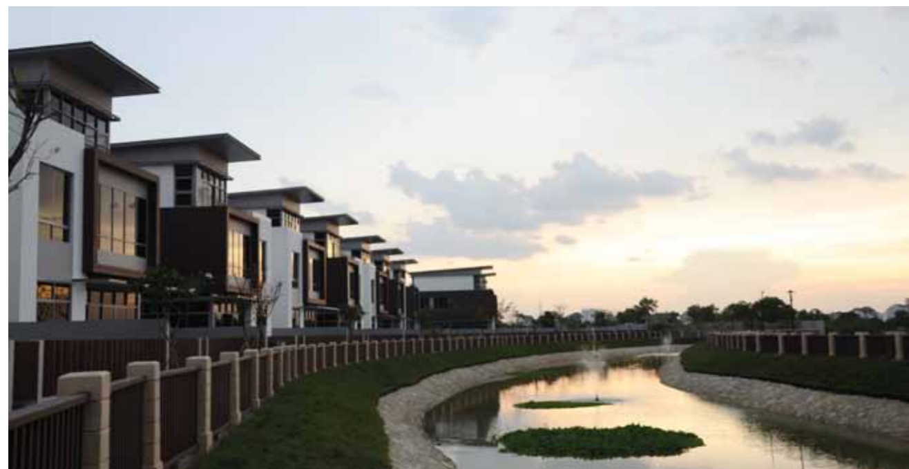
Khu biệt thự ven sông