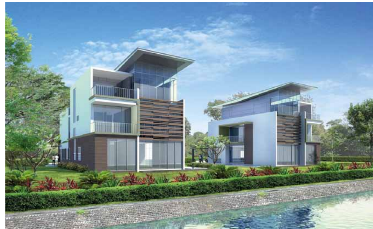
Phối cảnh biệt thự tại dự án

Nối tiếp thành công của dự án Riviera Cove, Quận 9, Tp. Hồ Chí Minh, Keppel Land đang chuẩn bị giới thiệu dự án biệt thự khác cũng tại Quận 9, tọa lạc tại phường Phú Hữu. Dự án này bao gồm 131 biệt thự cao cấp trải dài trên diện tích rộng 9,8 ha.